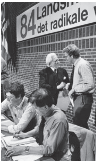
Hermod Lannung var altid en af de første på talerstolen på de radikale landsmøder, som her i Nyborg i 1984, hvor den 88-årige hilser på partiets daværende leder, Niels Helveg Petersen.

1958-67 meget engageret i arbejdet med konventionen om menneskerettigheder. I sit arbejde i Europarådet var han ligesom i FN altid meget aktiv, med taler og med personlige kontakter.