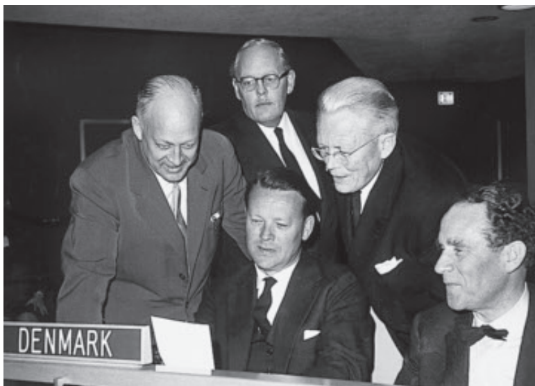
Hermod Lannung mødte under FN's generalforsamling i 1961 Jens Otto Krag, der var udenrigsminister. Året efter blev Krag statsminister og blev bl.a. drivkraften bag at få Danmark med i EU i 1973. Et projekt også Lannung var helhjertet tilhænger af.

bruge rigtig mange kræfter på i de følgende årtier. “FN bør være det centrale punkt i dansk udenrigspolitik”, skrev han. Og det lykkedes ham i 1963 at få nedsat og blive formand for “Udvalget til drøftelse af spørgsmålet om ændringer af FN's pagt”.