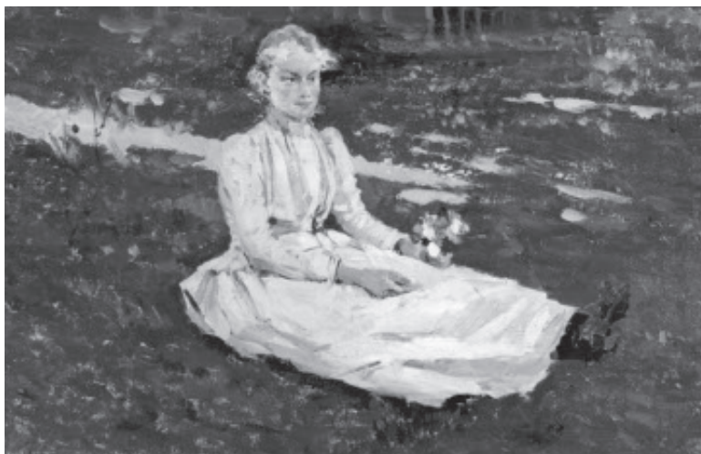
Under sit ophold i Sovjetunionen 1922-23 erhvervede Lannung også en del russisk kunst, bl.a. dette maleri af Vinogradov: Siddende pige med blomster, der i dag hænger på Sorø Kunstmuseum.

Den følgende tid blev præget af borgerkrig i Rusland. Fra 1. juli 1918 skiftede Lannung arbejdsgiver og kom til Moskva for at arbejde for Dansk Røde Kors. Det fortsatte han med til februar 1919.