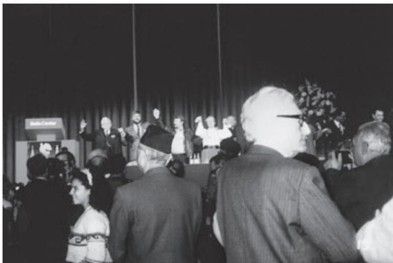
Lannung på podiet ved den kontroversielle interationale fredskongres i Bel-lacentret i 1986. PET-kommissionens rapport fra 2009 afslører, at efterretnings-tjenesten var meget aktiv i forsøg på at sabotere kongressen.

over 100 lande. PET fodrede udvalgte aviser med oplysninger, der førte til en række kritiske artikler, ligesom de aflyttede kongresarrangørernes telefoner.