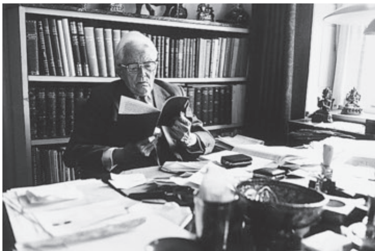
Helt op til efter sin 100 års fødselsdag i 1995 var Hermod Lannung aktiv ved sit skrivebord i lejligheden på Amager. Papirer og bøger studeres, og manuskripter bliver gennemrettet.

På en konference i Gentofte 1993 udtalte han sig således for “et globalt kollektivt sikkerhedsorgan gennem en styrkelse og videreudvikling af FN og knyttet hertil et verdensomspændende sæt af regionale sikkerhedssystemer”. Denne formulering var et slags omkvæd på de fleste af de indlæg, han holdt i sine sidste år.